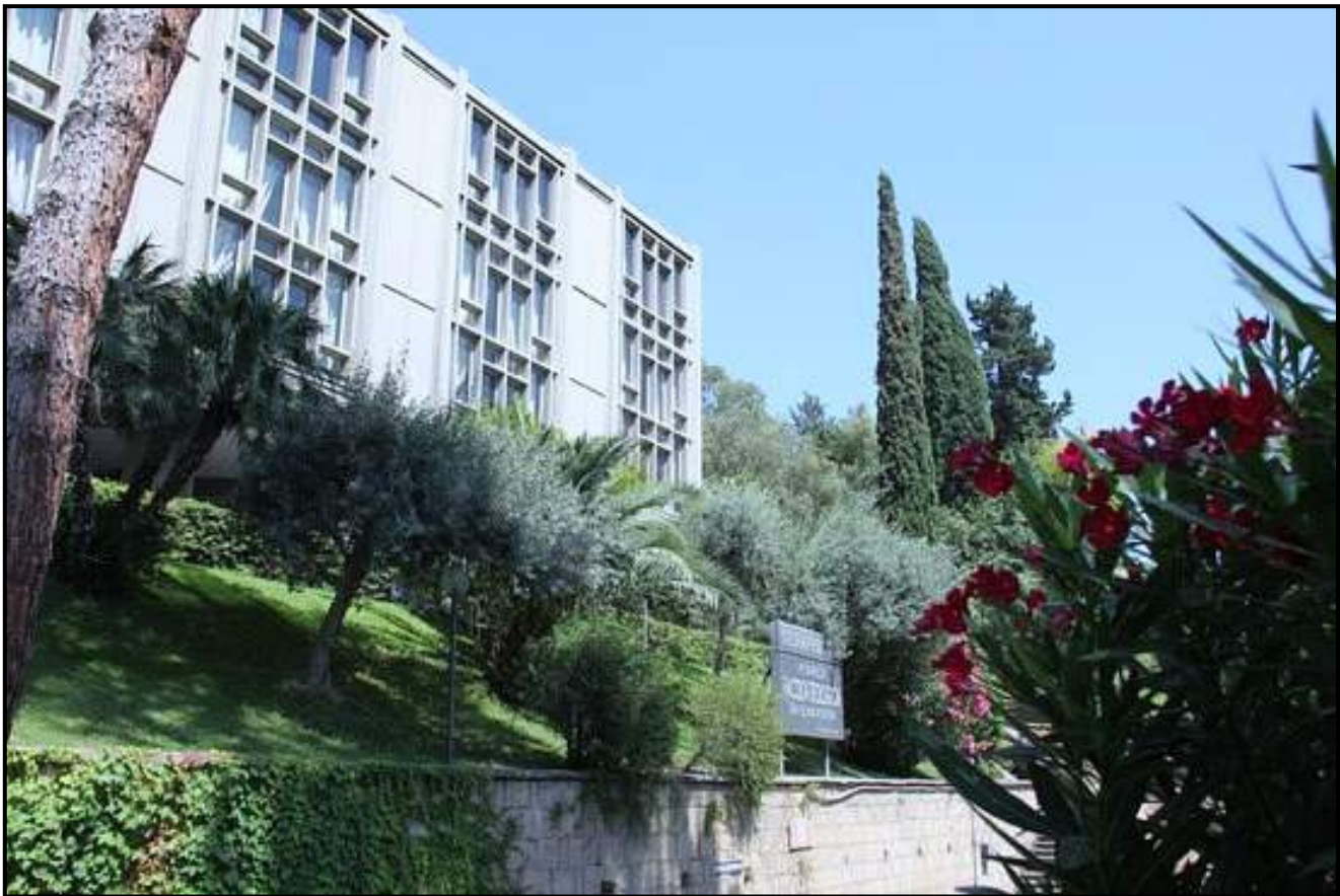
Complesso Scolastico "Seraphicum" Pontificia Facoltà Teologica "San Bonaventura" Via del Seraphicum 1-3 – 00142 Roma www.seraphicum.com www.sanbonaventuraseraphicum.org